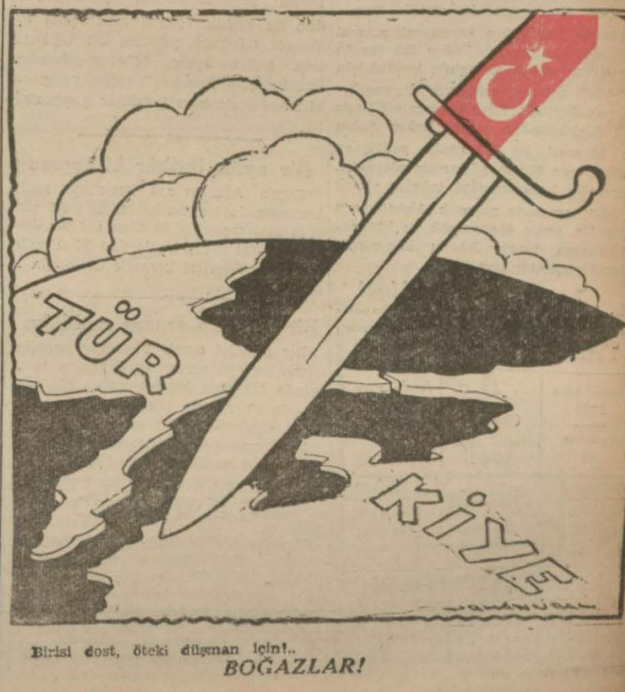
Birisi dost, öteki düşman için! BOĞAZLAR!

Herkesin, büyük şümüllü ve büyük ehemmiyetli haberlere sabırsızlıkla intizar etmekte olduğu bu sırada dünkü Alman resmi tebliğinin şark cephesi hareketine dair olan kısmı gene çok kısa idi ve bu cephedeki hareketin muvaffakiyetle devam ettiğinden başka bir şeyden bahsetmiyordu. Fakat, Alman askerî makamlarile bilhassa Londradan ve Stokholm'dan yerden diğer haberler, Leningrad'da doğru taarruz etmekte olan Alman ordularının Moskovadan Leningrad'a gelen üç demryolundan en şimaldekine dahi yaklaşıklarından bahsetmektedirler. Bu haberler arasında, hattâ Alman ileri unsurlarının Neva nehrine kadar ilerleyerek Leningrad şehrinin 25 kilometre mesafesine kadar yanaştıklarına ve Leningrad'daki Sovyet kuvvetlerinin yaptıkları bir mukabil taarruzla bu ileri unsurları tekrar beş kilometre geri çekilmeğe ihtar ederek kendilerinden bazı malzeme gitinam ettiklerine dair olanlar da vardır. Neva nehri, malûm olduğu üzere, Ladoga gölünün cenubu garbi ucundan çıkarak ağız şimalde müteveccih bir yarım daire halinde Leningrada müntehi olan ve orada Finlandiya körfezine dökülen kısa imtidadlı, fakat suyu mebzul bir nehirdir. Bütün uzunluğu 75 kilometredir. Derinliği 2 : 3 metre, genişliği ise 300 : 600 metredir. İkinciteşrin ortalarından veya nihayetlerinden Nisana kadar da donar. Bu nehrin Ladoga gölünde çıktığı noktadan Leningrada olan mesafesi ise kuşbakışı olarak 25 kilometreden bir parça fazladır. (Devamı 5 inci sayfada)