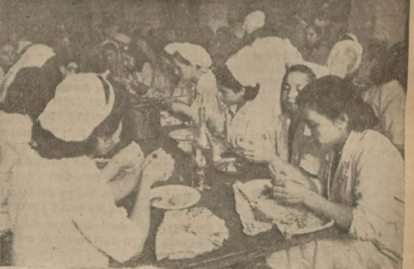
İnhisarlar Üsküdar bütün işleme evinde dünkü öğle yemeği Bir yaşlı işçi kadın, göz yaşları içinde şöyle söylüyordu: «Allah sizi inandırsın, geçen kurban bayramında, komşunun gönderdiği ettten başka kursağıma aylardır et gr-memişti. Cenabıhak razı olsun, hergün sıcak yemek ve et yiyorum.» (Devamı 2 inci sayfada)

İnhisarlar İdaresi kararını Üsküdar bütün işleme evinde tatbika başladı, bu karar bütün vilâyetlere teşmil edilecek