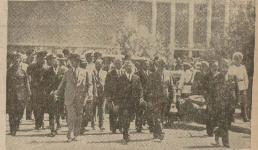
Millî Şefin İzmir seyahatlerine aid bir intiba Balıkesir 4 (A.A.) — Millî Şef İsmail Paşa, Millî Şef, cadde ve sokaklarda toplanan on binlerce halkın coşkun tezahüratıyla İzmirden Balıkesire gelmişlerdir. (Devamı 5 inci sayfada)

Millî Şef halkın coşkun tezahüratı arasında Balıkesirden ayrıldılar