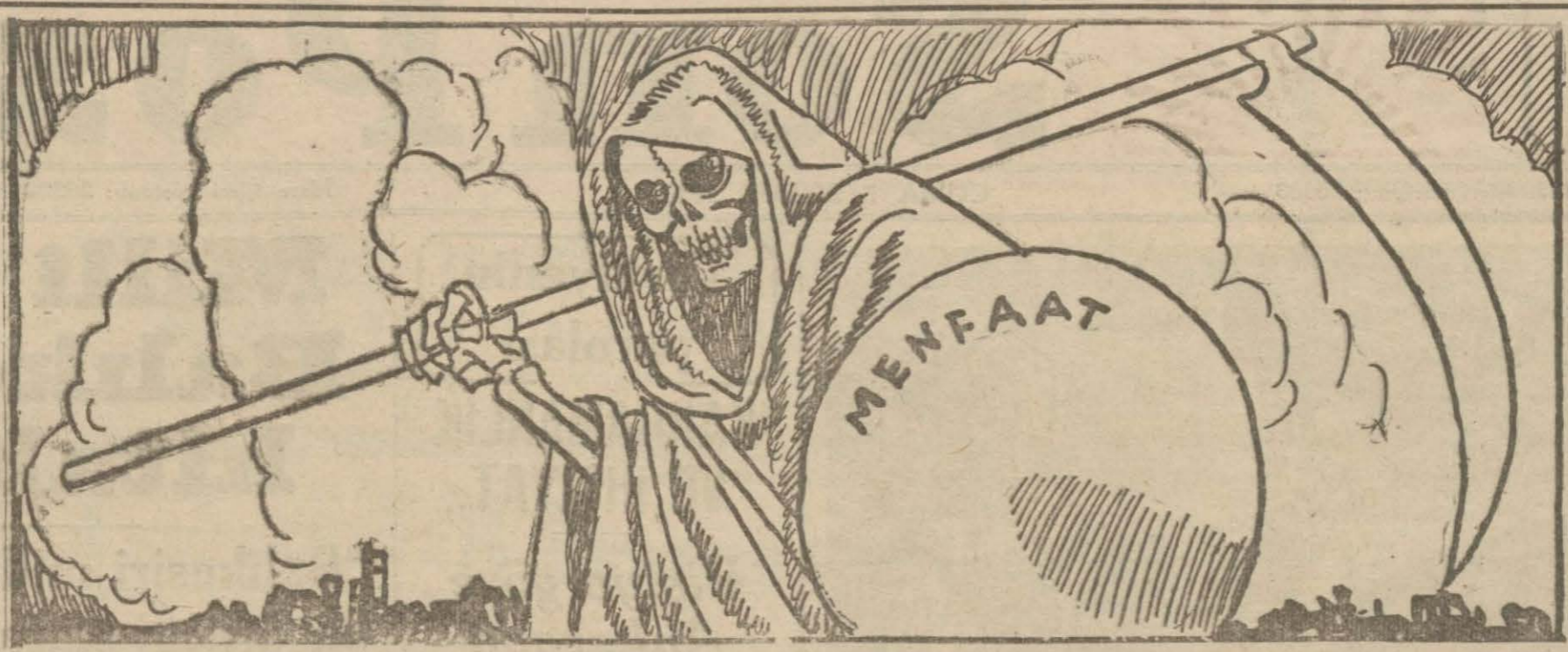
«Hiçbir şey haklı, hiçbir şey haksız, hiçbir şey doğru, hiçbir şey yanlış, hiçbir şey faydalı, hiçbir şey zararlı değildir, bugünün cinayeti yarının faziletidir.» Harb zamanında değişmeyen düşünce, sarsılmayacak kanaat az bulunur. Aldanmamak, teessüre düşmemek, fikir değiştirmemek mi istiyorsun? Söylenen söze değil, yapılan harekete bak, söz geçer, hareket kalır, fillin yaptığı işir devam eder. Harb zamanında değişmeyen bir tek hakikat vardır, adına menfaat derler.